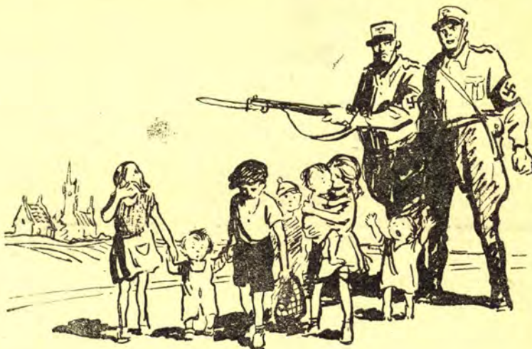
В фашистскую неволю.

Советский народ не простит гитлеровцам их кровавых злодеяний. За кровь и слезы русских детей фашистские детоубийцы поплатятся потоками своей бандитской крови. Час расплаты недалек!