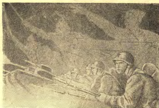
Бьемся мы здорово, Рубим отчаянно,

Бойцы и командиры знают, что предстоят еще суровые и тяжелые бои, но они знают также, что близится время, когда Красная Армия вместе с армиями наших союзников — Англии и США — сломает хребет фашистскому зверю.