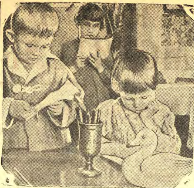
Любовью и вниманием окружены дети фронтовиков в детском саду № 6 гор. Фрунзе (Киргизская ССР).

В летний день за целебными травами Мы идем по тропинке лесной. Помоги нам, березка кудрявая, Ты нам тайну лесную открой.